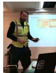
Training vor Ort