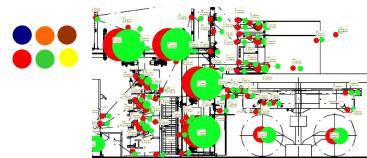
Detaillierte und aussagekräftige Berichte